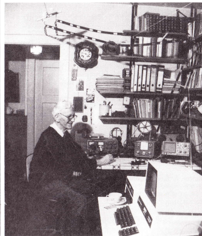
Shack von HB9CO

TS520, Recorder, alter Morseschreiber, KW 107 Supermatch, Hameg Oszi 20 Mhz, zentr. gespiesene Quad, Matchbox, FT 277, Steuergerät, MN 2000 Drake, TR 2500 2m-Transceiver, zwei PC