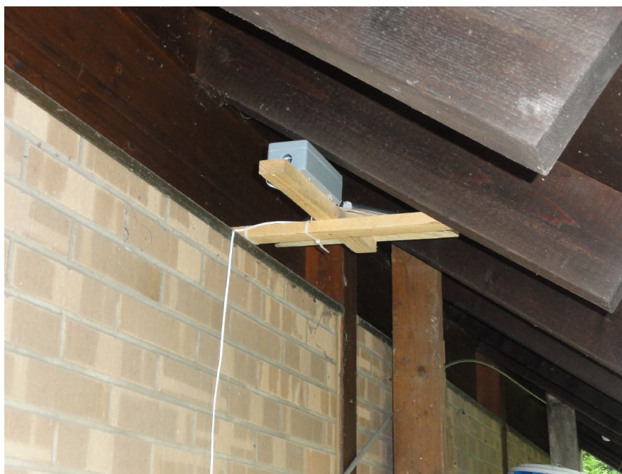
Empfänger 1 auf der Nordseite des Hauses für die Richtungen NW/SO und NO/SW