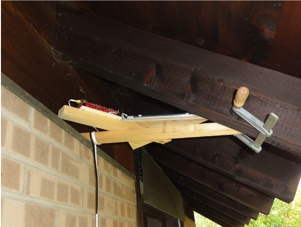
Empfänger 2 auf der Südseite des Hauses für die Richtungen N/S und O/W. Das Gehäuse fehlt noch.

Die Installation der Empfänger ist nur provisorisch für Testzwecke. Aber wie wir ja alle wissen, diese Tests können sich in die Länge ziehen und damit auch das Provisorium länger dauern.