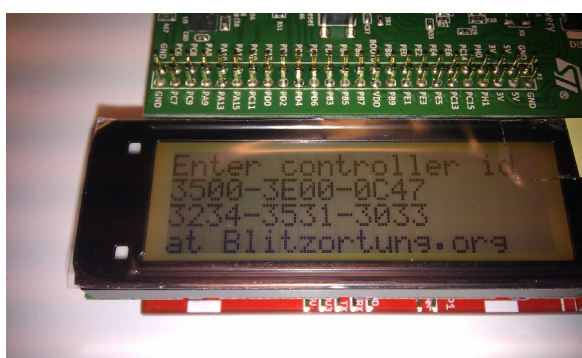
Abbildung 1: Da läuft er schon, der Blitzorter...